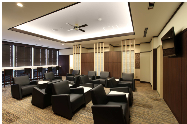
人間ドック特別待合室