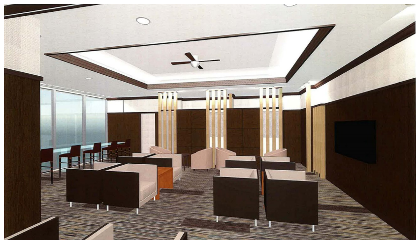
人間ドック特別待合室