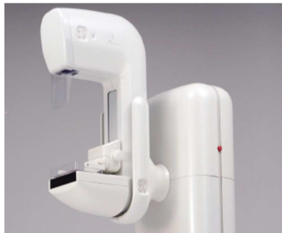
乳がんマンモグラフィー撮影装置

お問い合わせ、お申し込みは 電話:079(429)2525 まで 午前8:30～午後5:00 (日曜・祝日・年末年始を除く)