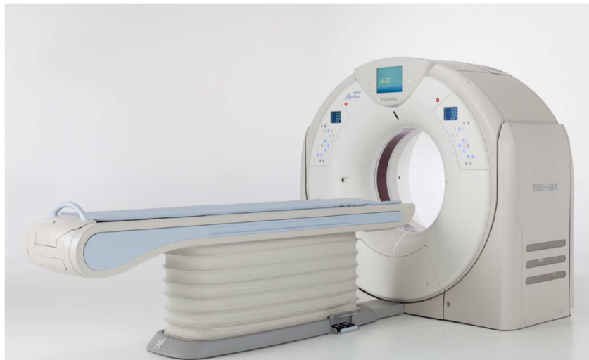
低線量胸部CT撮影装置

お問い合わせ、お申し込みは 電話:079(429)2525 まで 午前8:30～午後5:00 (日曜・祝日・年末年始を除く)