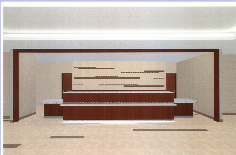
健診受付カウンター

お問い合わせ、お申し込みは 電話：079(429)2525まで 午前8:30～午後5:00 (日曜・祝日・年末年始を除く)