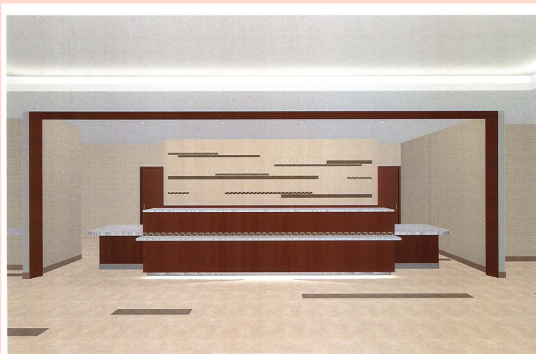
健診受付カウンター

お問い合わせ、お申し込みは 電話:079(429)2525まで 午前8:30～午後5:00 (日曜・祝日・年末年始を除く)