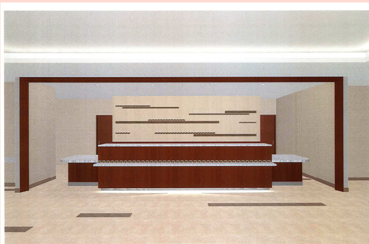
健診受付カウンター

お問い合わせ、お申し込みは 電話:079(429)2525まで 午前8:30～午後5:00 (日曜・祝日・年末年始を除く)